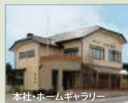
本社・ホームギャラリー