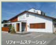
リフォームステーション

本社・ホームギャラリー リフォームステーション 太陽光発電システム設置 〒958-0052 村上市八日市14-6 ☎ 0254-56-6259